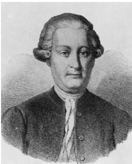
Leopold Auenbrugger 1722-1809

Lange Zeit war die medizinische Fakultät Wiens die weltweit erste Adresse für angehende Ärzte. Aus aller Welt kamen die Studenten, um bei den berühmtesten Medizinern zu lernen. Schon unter Maria Theresia wirkten bedeutende Ärzte, wie van Swieten und Leopold Auenbrugger, in der Hauptstadt. Rund hundert Jahre später war es die „zweite Wiener Medizinische Schule“, die von Persönlichkeiten, wie Rokitansky, Hebra, Skoda und Billroth, mitgeprägt wurde. Bis in die erste Hälfte des 20. Jahrhunderts setzte sich die Erfolgsgeschichte fort, man denke an Wagner-Jauregg, Bárány und Landsteiner, die alle mit dem Medizin-Nobelpreis ausgezeichnet wurden.